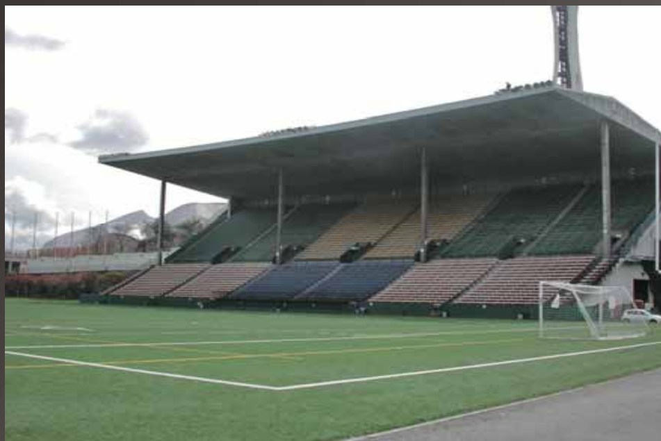
Federal Way Memorial Field

1300 S 308 th St., Federal Way, WA 98003